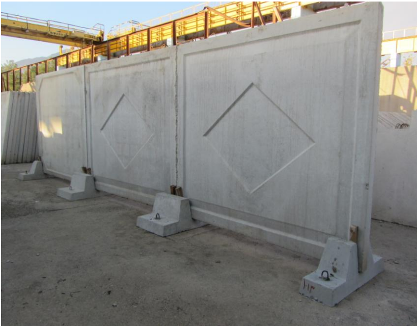
۴- دیوار بتنی به ابعاد طول ۲,۵ متر و ارتفاع ۳ متر و ضخامت دیوار ۱۲ سانتیمتر طرح لوزی