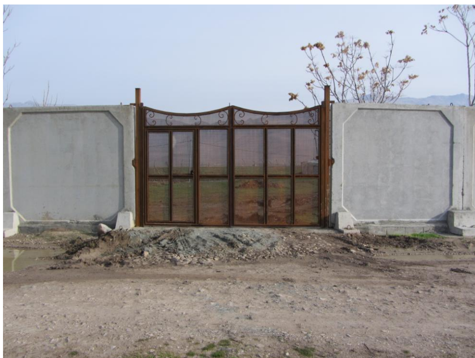
۳- دیوار بتنی به ابعاد طول ۲,۹ متر و ارتفاع ۲,۵ متر و ضخامت حاشیه دیوار ۱۲ سانتیمتر و داخل دیوار ۹ سانتیمتر طرح ساده