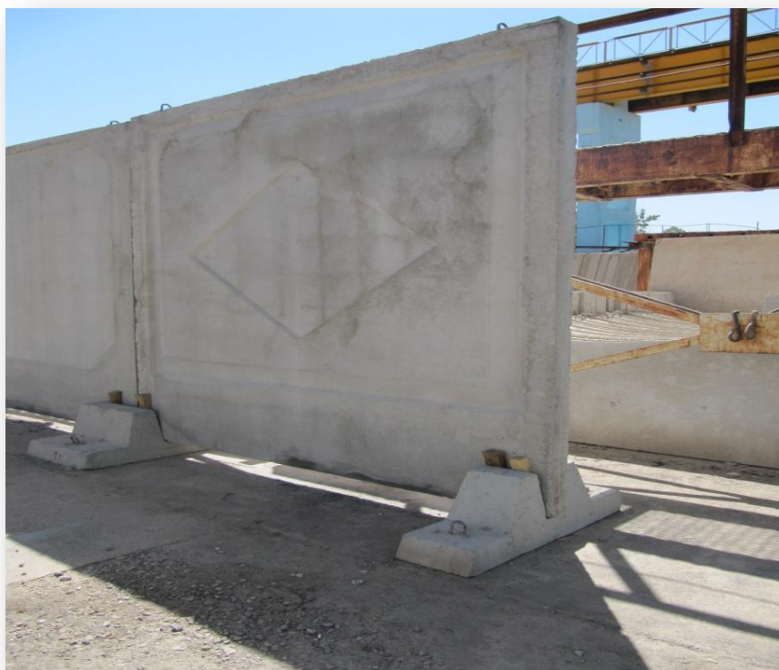
۲- دیوار بتنی به ابعاد طول ۲,۹ متر و ارتفاع ۳ متر و ضخامت دیوار ۱۲ سانتیمتر طرح لوزی